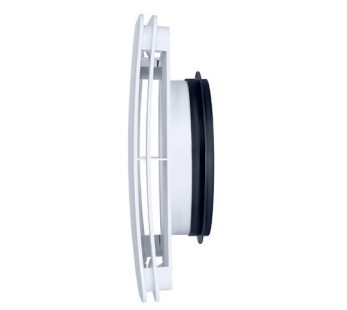
plastový anemostat BDOP LITE